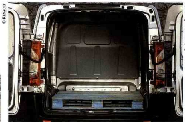
Contrôlez la nature de la cloison et le rangement d'une palette. Ici le Peugeot Expert.

La présence de portes battantes asymétriques à l'arrière permet un accès aisé.