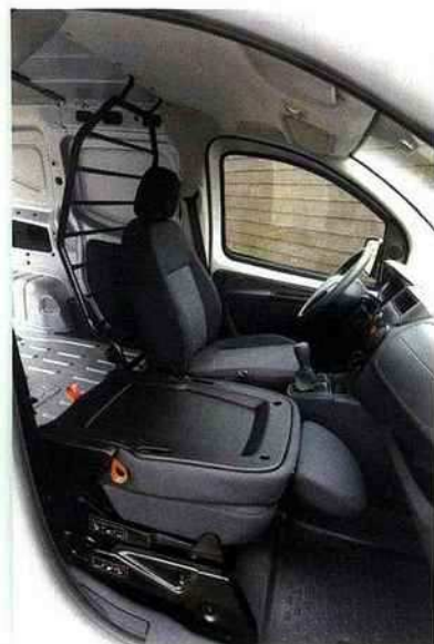
Siège passager escamotable pour le Peugeot Bipper.