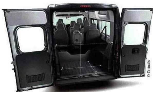
Utilisation combinée travail-loisirs du Jumper Combi.

Enfin, pour le froid embarqué, les constructeurs ont des