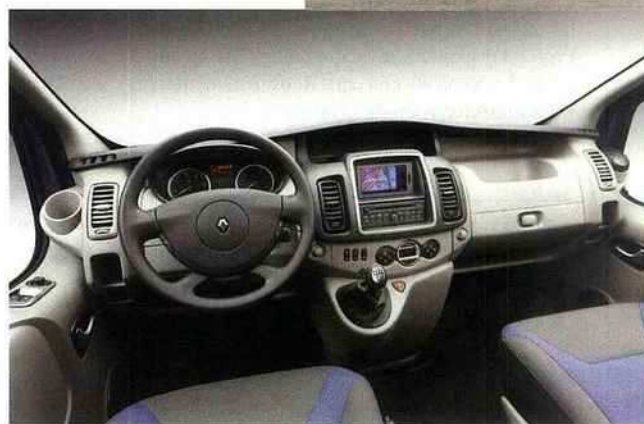
GPS intégré au tableau de bord, utile contre les vols. Renault Master.

Au cœur de l'utilitaire, la capacité est la première chose à regarder : pour les fourgonnettes (Renault Kangoo, Peugeot Partner et Bipper ou Citroën Berlingo et Nemo) elle s'étend de 2 m 3 à 3,5 m 3 ; pour les petits fourgons, de 3 m 3 à 8 m 3 (Renault Trafic, Peugeot Expert et Citroën Jumpy) et pour les grands fourgons, de 8 m 3 à 17 m 3