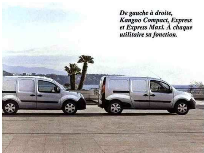
De gauche à droite, Kangoo Compact, Express et Express Maxi. À chaque utilitaire sa fonction.